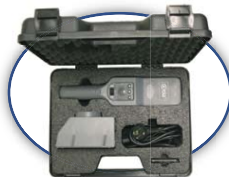
Valigetta contenitore V140

La forma ergonomica e l'elevata sensibilità di intercettazione del PD140SVR consentono rapide ed accurate operazioni di ispezione