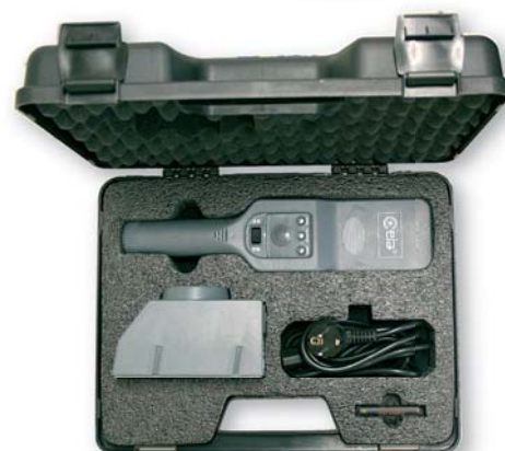
MALLETTTE DE RANGEMENT V140